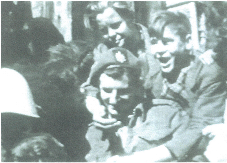
Canadese soldaten worden uitbundig begroet door Deventer jongeren.

kwam het bevel van brigadegeneraal Gibson om de aanval op Schalkhaar in te zetten. Wie zich een voorstelling wil maken van het verloop van de strijd daar, moet zich inleven in de plattegrond van het dorp tijdens de oorlog. De plattegrond van Schalkhaar zag er uit als een gaffel, een tweetandige hooivork. Men kan ook denken aan de Griekse letter Y. De steel of de poot werd gevormd door de verbinding van Schalkhaar met de Brinkgreverweg op Deventer grondgebied. De linkertand van de gaffel werd gevormd door wat thans de Koningin Wilhelminalaan heet en een voortzetting vindt in de langs de Westenbergkazerne lopende Spanjaardsdijk. De rechtertand door de Oerdijk, die naar de Cröddenbrug reikt. De kern van het dorp bevond zich tussen de Koningin Wilhelminalaan en de Oerdijk. Nagenoeg evenwijdig aan de Koningin Wilhelminalaan en de Oerdijk liep de Pastoorsdijk. De punten van de gaffel werden verbonden door de Kolkmanweg.