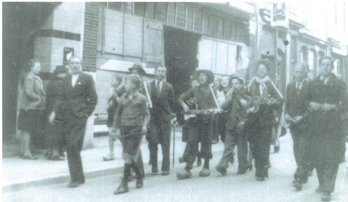
Spontaan trekken groepjes Deventenaren door de straten om uiting te geven aan hun vreugde over de bevrijding.

De dreiging die uitging van het Duitse geschut leidde tot een Canadees antwoord. Op 10 april leidde dat tot vier burgerslachtoffers op de Hoven. Een huis aan de Bloemstraat kreeg een voltreffer, waarbij de bewoners omkwamen. Onder de vier slachtoffers bevond zich een kind dat door een scherf werd getroffen. De bewoners van Knutteldorp, de Zutphenseweg en rond de (niet meer bestaande) Fennenoordsweg wachtten op 10 april tevergeefs op de Canadezen. Bevrijding van dit stadsdeel werd overgelaten aan groepen die vanuit Epse de stad binnen zouden komen zodra de hoofdmacht van de brigade tot het centrum van de stad was doorgedrongen. Om ongeveer een uur in de nacht van dinsdag 10 op woensdag