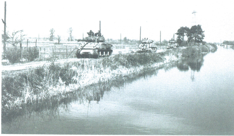
Een tankeskader van de 7e Canadese Brigade rukt langs het Overijssels Kanaal op in de richting van de Cröddenbrug te Schalkhaar.

er nog de wind onder. Vordenaren die zich in de dorpskom op straat waagden, werden door Duitse militairen, die door de tuinen slopen, in hun huizen teruggedreven. Intussen rolde die ene gevechtswagen, omgeven door uitbundige Vordenaren, verder het dorp in. Een Vordense inwoner vond het maar niets. 'Wanneer komt het leger nou?', wilde hij van de Canadese sergeant weten, die met zijn verrekijker de omgeving aftuurde. 'This is the army', antwoordde hij zelfverzekerd.