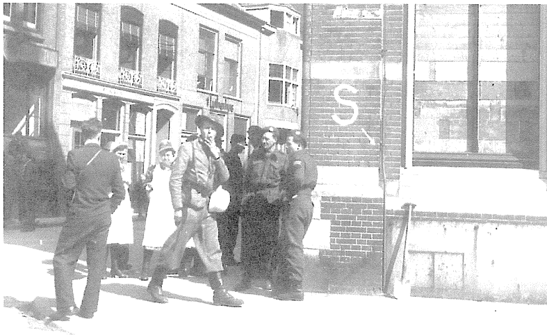
Canadese militairen bij het postkantoor, dat door moedig optreden van het verzet voor vernieling werd behoed.

de Canadezen nog in de straten van Deventer vochten. Dieperinks molen, eens een karakteristiek punt in de Weseper lintbebouwing langs de Raalterweg, diende de Duitsers als waarnemingspost. De Hauptmann raakte in de loop van de avond in paniek. Hem was gemeld dat er weliswaar in Deventer gevochten werd, maar dat verkenningseenheden van de Canadezen al rondzwierven in de buurt van abdij Sion en dat zij oostelijk door het beboste gebied van Averlo waren opgerukt tot aan het open gebied dat Wesepe van de Malbergerweg scheidt. Hij sommeerde een groepje soldaten op verkenning uit te gaan. Zij kregen de boodschap mee 'zu schiessen' wanneer ze ook maar iets verdachts bespeurden. Het was een loze boodschap, want de soldaten hadden geen wapens meer.