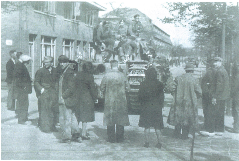
Een Canadese tank-eenheid krijgt even een adempauze. Deventenaren bekijken vol bewondering hun bevrijders.

sergeant vuursteun aanvraag van de in de nabijheid gelegen Canadese mortiergroep, doken de Duitsers de sloot in. De mortiergranaten, die in hun directe omgeving belandden, maakten hen verstandig. Een witte vlag ging omhoog en drieëntwintig Duitsers beleefden het einde van hun oorlog.